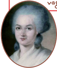
Olympe de Gouges (1748-1793).

Une Déclaration des Droits de la Femme et de la Citoyenne fut rédigée en 1791 par Olympe de Gouges, auteur de nombreux écrits en faveur des femmes et de l'abolition de l'esclavage.